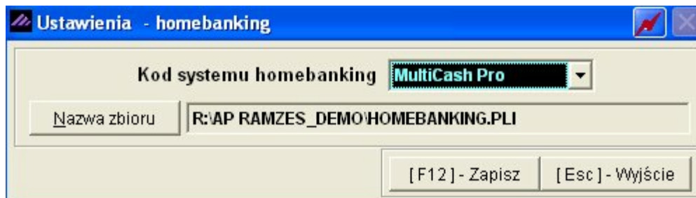
Przygotowanie programu do pracy

Program Płace umożliwia współpracę z wybranymi programami do realizacji przelewów bankowych. Odbywa się to w ten sposób, że z programu płacowego tworzony jest plik z przelewami, który następnie przenoszony jest się do aplikacji bankowej. Pierwszą czynnością jaką należy wykonać jest zdefiniowanie rodzaju aplikacji bankowej oraz ustalenie zbioru eksportowego. Robi się to w Ustawienia /home-banking wybierając „Kod systemu homebanking”, a następnie „Nazwę zbioru”, który należy zapisać na dysku.